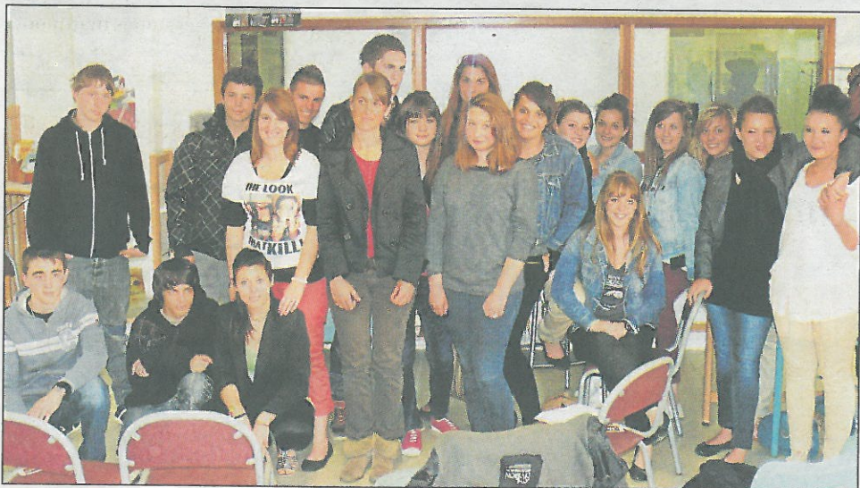
Les élèves ayant participé à la rencontre